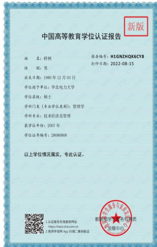
2022年8月15日后新版报告